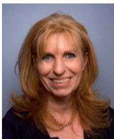
Adjointe à l'urbanisme, à l'environnement et au développement durable, Conseillère communautaire CCSV